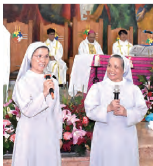
▲發願金慶修女感性致詞