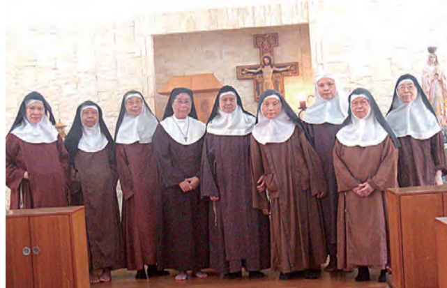
▲修女們以默觀祈禱善度修道生活