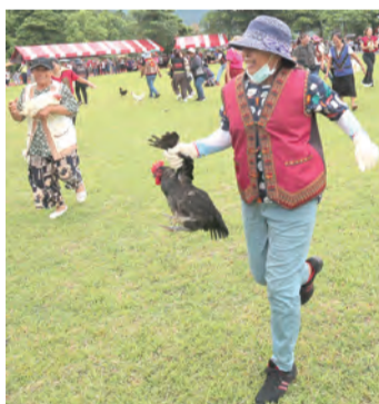
▲民俗婦女抓雞比賽高潮迭起，歡樂滿點！