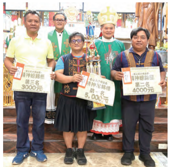
▲劉振忠總主教頒發精神總錦標前三名

地門鄉聖十字架堂區；第2名：春日玫瑰聖母堂區；第3名：來義鄉聖保祿堂區。袋鼠跳第1名：瑪家鄉聖若瑟堂區；第2名：霧台鄉耶穌聖心堂區；第3名：桃源區方濟堂；抓雞接力賽第1名：霧台鄉耶穌聖心堂區；第2名：瑪家鄉聖若瑟堂區；第3名：來義鄉聖保祿堂區。除了獎牌還有獎金鼓勵喔！最讓人興奮的精神總錦標，獎金最高，第1名：霧台鄉耶穌聖心堂區，獎金5000元；第2名：瑪家鄉聖若瑟堂區，獎金4000元；第3名：來義鄉聖保祿堂區，獎金3000元。活動在全體參禮者高聲歌頌天主中，載歌載舞、熱鬧地攜手畫下圓滿句點。