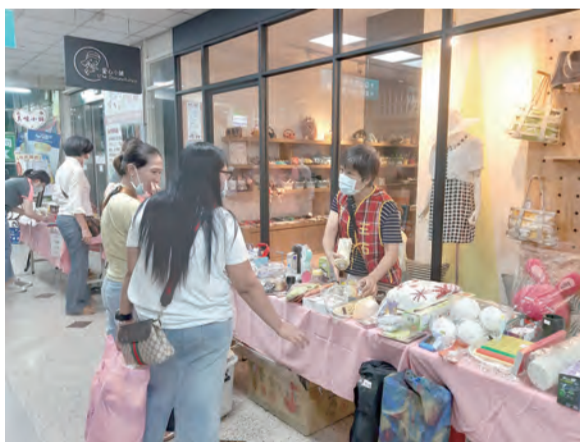
▲▼聖馬爾定醫院每年都辦愛心義賣活動，民眾也主動來找寶貝、做公益。