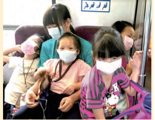
▲安安團送溫暖，小朋友們都很期待大哥哥大姊姊來。