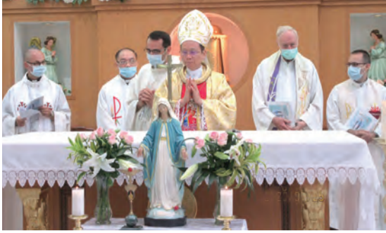
▲聖母軍慶祝在台70年，由鍾安住總主教主禮。