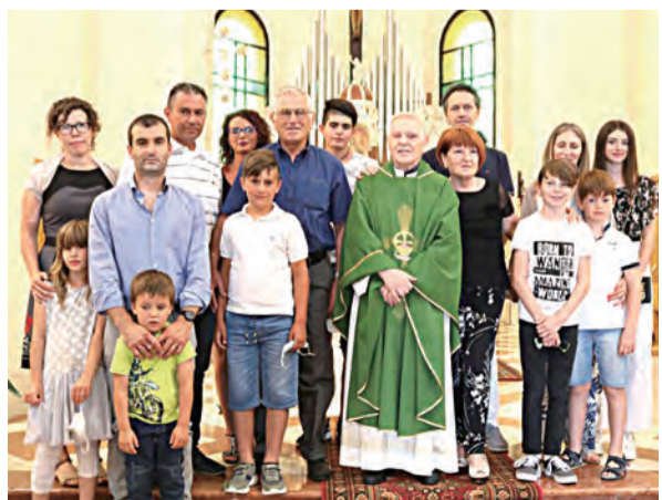
▲家人親友同來祝賀，天主的恩寵把大家族的愛緊緊維繫。

晉鐸50周年，按照《聖經》上所說，是一個喜樂與感恩的時刻，正如農夫感謝天主為他的豐收。在此50周年紀念之際，我要感謝這偉大的牧人，帶領我50年司鐸生活中，讓我能台灣，為教會和信徒提供服務，去年台灣教友邀請我今年7月回台灣，並慶祝我的晉鐸50周年，可惜因全球疫情的關係而不能成行。親愛的台灣朋友們，我現在只能邀請你們分享在義大利，我的晉鐸50周年感恩祭典，見證天主在這50周年所賜給我特別恩典，主！我的主！感謝祢！