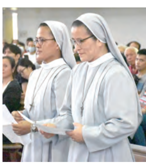
▲入會銀慶修女虔敬發願