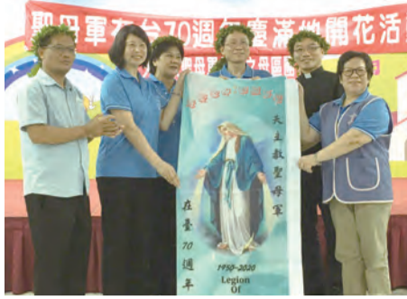
▲新莊教會之母區團交接給台中督察區團。