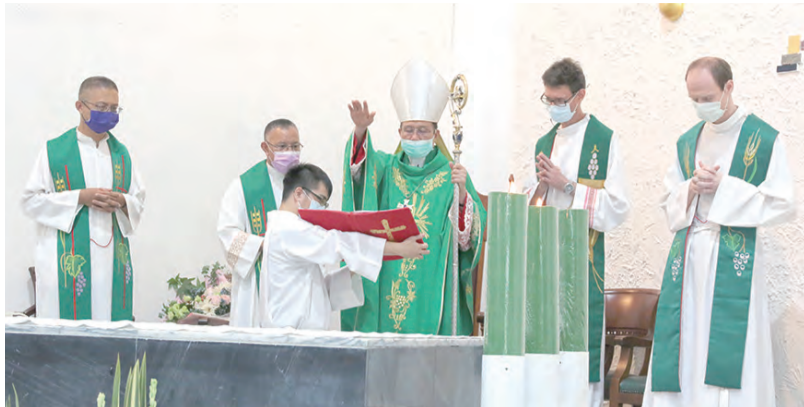
▲聖三堂令人不捨與歡欣的迎新送舊都在溫馨的感恩彌撒中。