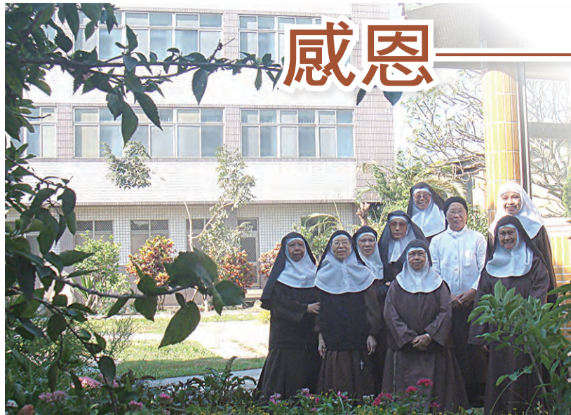
▲後花園初學院團體照