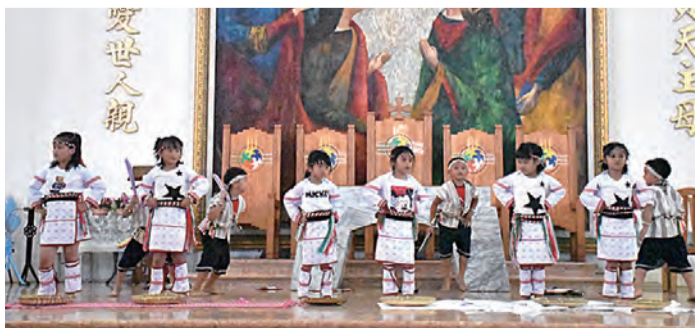
▲修女們平日所照顧的小朋友們超萌演出

安德啟智中心院童表演精彩舞蹈，體會得出平日修女照顧的愛心，其他6所幼兒園也輪番上台表演，也許62號就在她們身上！迎賓牆右下角拼圖上的缺角，正是尋覓62號聖瑪爾大修女，期盼63、64……號接踵而來，聖召多多益善，開枝散葉繁茂，讓聖瑪爾大修女會培育的百合花開遍花東的山巔海涯，造福天主子民，使主愛川流不息。