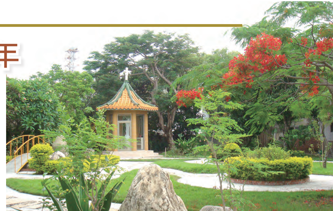
▲環境清幽的聖佳蘭隱修院

教會的歷史相似一條蜿蜒，永不乾涸的生命之河，其所經之處，蘊含著及給予了豐富的生命，教會中每個創立修會的會祖，亦像是一個藏著無價之寶的寶庫，每個時代歷久彌新的等待著人們去發掘新的寶藏。而因著天主無條件的恩典，今年我們也邀請您與我們同頌主恩，並與我們一起祈禱，感謝天主聖三的一切護佑，讓我們在台灣鹽水建院30年。孔子曰：「三十而立；四十而不惑；五十而知天命；六十而耳順；七十而從心所欲，不逾矩。」三十而立，的確是生命邁向生命的另一個階段，期待能穩健而踏實地往前邁進及成長茁壯，在此感恩的時刻，我們首先要回憶紀念會祖聖女佳蘭聖德非凡的一生。