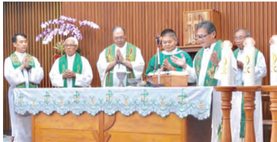
▲劉振忠總主教禮閉幕彌撒，黃兆明主教及4位神長共祭。 ▶2020全國明愛年會圓滿落幕，明愛人滿懷愛德戮力前行。

堂區是達成教會職責——宣講天主聖言、舉行聖事、實踐仁愛工作的最好地方，該努力實踐仁愛工