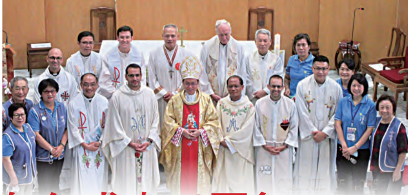
▲參禮神長與各區團團長合影