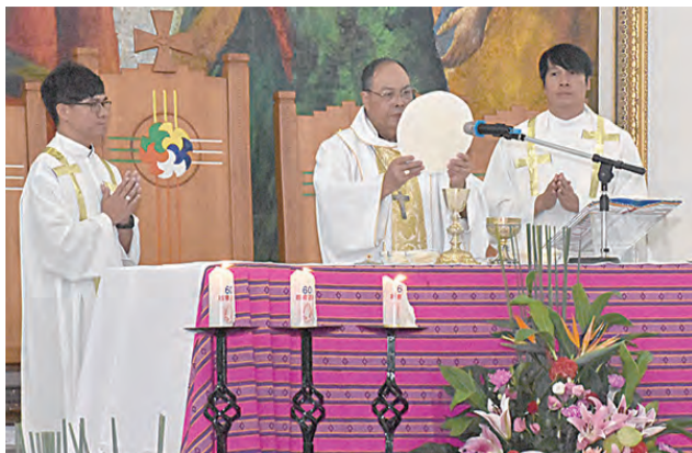
▲歡慶60年鑽石慶感恩彌撒溫馨感人